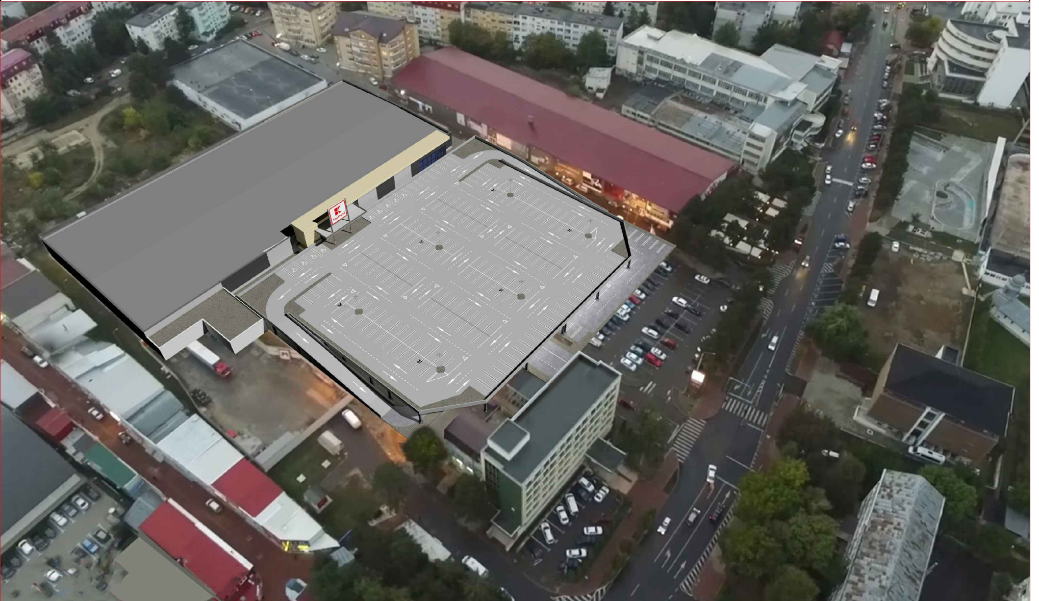
PERSPECTIVA NR. 1